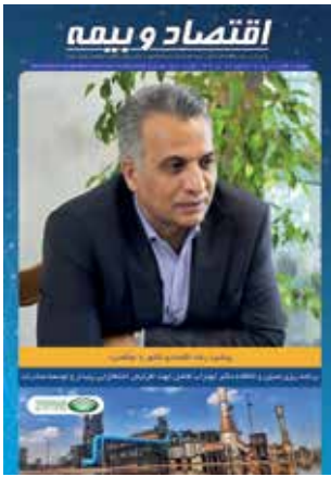
ماهنامه اقتصاد و بیمه شماره ۱۶۹ - دی ۱۴۰۳